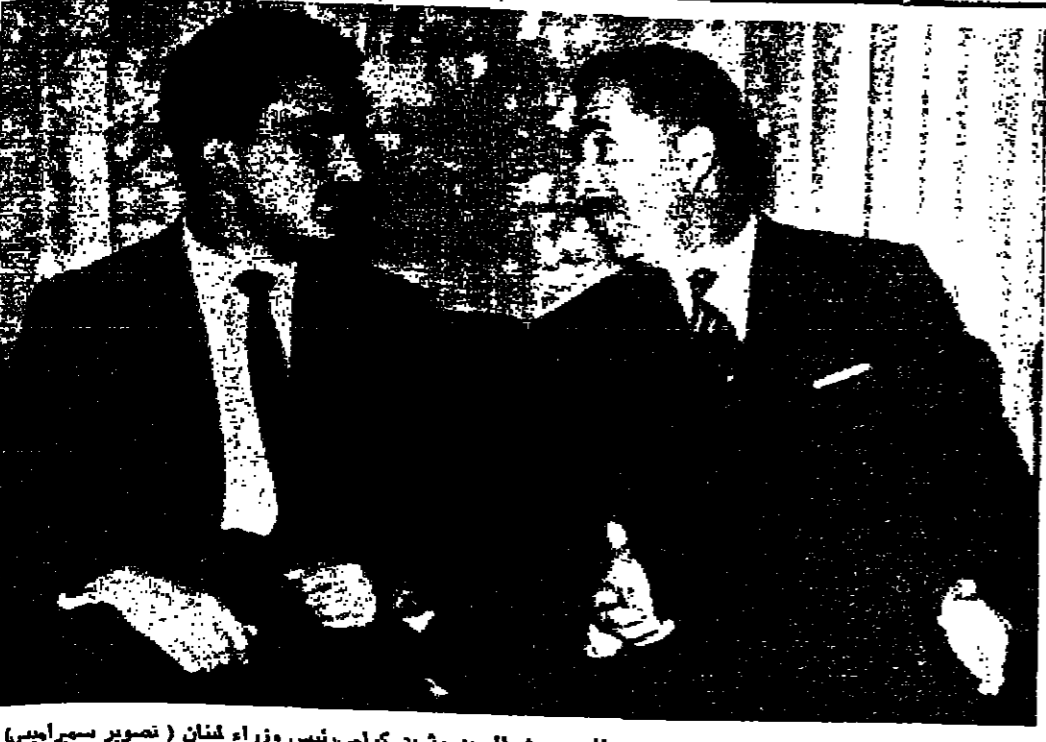
سور الابن حسن ولي العهد المعظم يسلم الى حديث السيد رشيد كرامي رئيس وزراء لبنان

لندن - قدم الجنرال جيمس اغيندورغود سبيث قائدا القوات الجوية في بريطانيا استقالته من منصبه احتجاجا على تخفيض موازنة الدفاع في بريطانيا . وكذلك قدم ديسموند دونالي احد نواب الصاح البيئي في حزب العمال استقالته من الكتلة البرلمانية احتجاجا على سياسة الحكومة البريطانية تجاه القواعد البريطانية في شرق السويس .